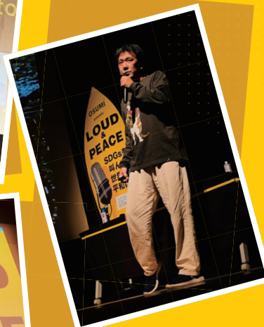
社員研修や学生の 学びの機会にも