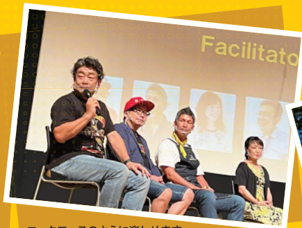
ロックフェスのように楽しめます