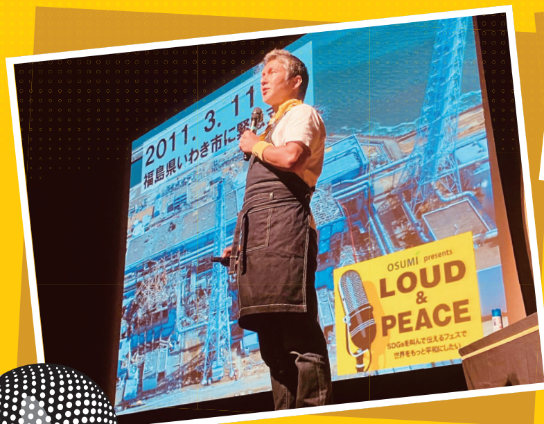
有識者や活動家が次々にプレゼン