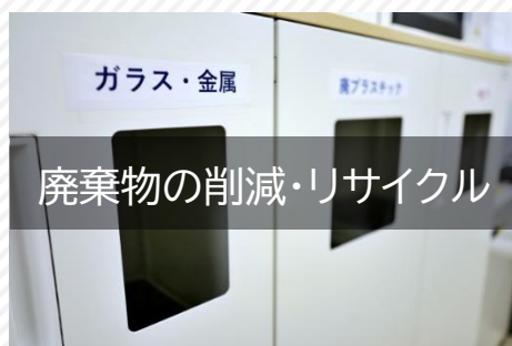
廃棄物の削減・リサイクル