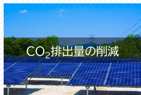
CO 2 排出量の削減